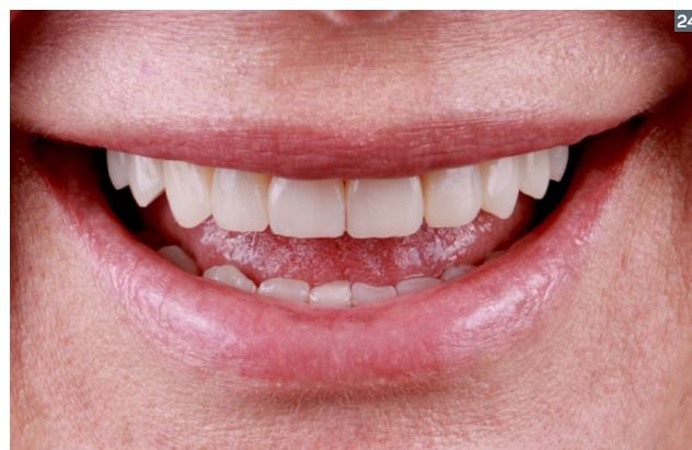
20. Final smile from the side. 21. Final intraoral appearance. 22. Intraoral aspect of the upper arch. 23 and 24. Final smile. 20. Sonrisa final lateral. 21. Aspecto intraoral final. 22. Aspecto intraoral arcada superior. 23 y 24. Sonrisa final.