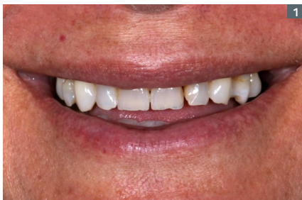
1. Initial smile. 1. Sonrisa inicial.