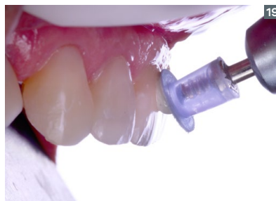
18. Finishing performed with Diamond Pro sandpaper disks. 19. Final polishing with felt disks (Diamond Flex) and Diamond Excel polishing paste.

18. Acabado con discos de lija Diamond Pro. 19. Pulido final con discos de fieltro flexibles (Diamond Flex) y pasta para pulido Diamond Excel.