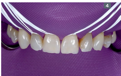
4. Absolute isolation. 4. Aislamiento absoluto.