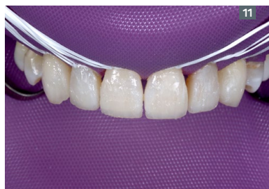
11. Composite Trans OPL applied to the dentin layer. 11. Resina del color Trans OPL aplicada sobre la capa de dentina.