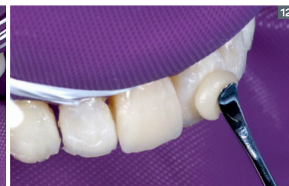
12. Application of the EA2 enamel composite layer. The consistency of Vittra APS is extremely conducive to good smoothing and sculpting. 12. Aplicación de la capa de resina de esmalte EA2. La consistencia de Vittra APS es extremadamente favorable a un buen alisado y escultura.