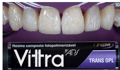
10. Application of the incisal layer of shade Trans OPL. 10. Aplicación de la capa incisal del color Trans OPL.