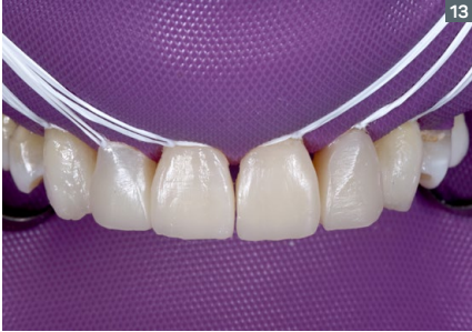
13. Result after positioning the composites.

13. Resultado tras posicionamiento de las resinas.