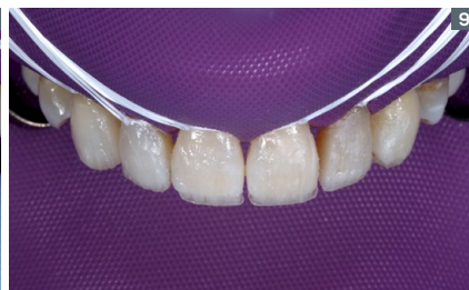
9. Application of the first layer of dentin composite (shade DA2) and making of the mamelons. 9. Aplicación de la primera capa de resina de dentina (color DA2) y confección de los mamelones.