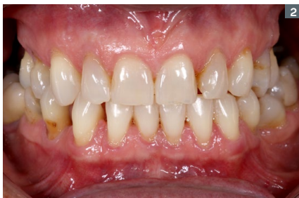
2. Initial intraoral appearance. 2. Aspecto intraoral inicial.