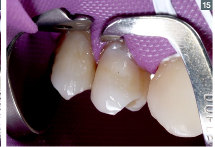
15. Application of a Opallis layer in shade Opaque Pearl, in order to mask the darkened dentin in the cervical region.

14. Readecuación del aislamiento en los premolares de modo a permitir una mejor adaptación en la región cervical.