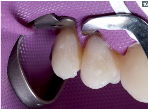
16. Vittra APS dentin composite layer in shade DA2 and posterior enamel composite layer in shade EA2.

16. Capa de resina de dentina Vittra APS color DA2 y posterior capa de resina de esmalte en el color EA2.