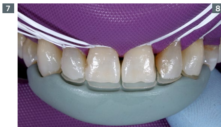
8. Positioning of the silicone guide (already with the composite) by the palatal side of the upper teeth and light curing. 8. Posicionamiento de la guía de silicona (ya con la resina) por la faz palatina de los dientes superiores y fotoactivación.