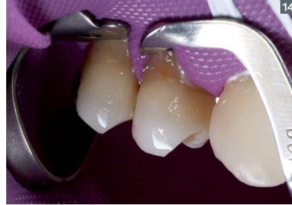
14. Re-fitting the isolation on the premolars in order to allow a better adaptation in the cervical region.

13. Resultado tras posicionamiento de las resinas.