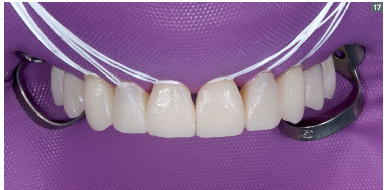
17. Restorations finished in the upper arch before finishing and polishing.

16. Capa de resina de dentina Vittra APS color DA2 y posterior capa de resina de esmalte en el color EA2.