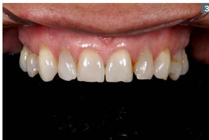
3. Intraoral aspect of the upper arch. 3. Aspecto intraoral de la arcada superior.