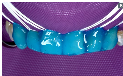
5. Acid etching of enamel for 30 seconds (Condac 37). 5. Grabado ácido del esmalte por 30 segundo (Condac 37).